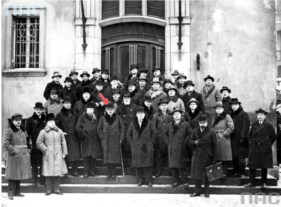
Narodowe Archiwum Cyfrowe, sygn. 1-G-915

Encontro do Comitê Principal da Exposição Nacional em Poznań (Janeiro de 1929) (Fonte: adaptado de NAC - www.audiovis.nac.gov.pl ) [ Zjazd Rady Naczelnej Powszechnej Wystawy Krajowej w Poznaniu (styczeń 1929 r.) ] (Źródło: adaptacja z NAC - www.audiovis.nac.gov.pl )