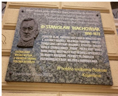
Placa comemorativa em Inowrocław, em Kujawy. (Fonte: Família Wachowiak) [Tablica pamiątkowa w Inowrocławiu, na Kujawach. (Źródło: ze zbiorów Rodziny Wachowiak)]

Descerramento da placa comemorativa na parede do Banco Cooperativo em Inowrocław. Discursa o embaixador do Brasil, Carlos Alberto de Azevedo Pimentel. (Fonte: Edmund Mikołajczak. Inowrocław na progu II Rzeczypospolitej. 2001, pág.19-33) [Uroczystość odsłonięcia tablicy pamiątkowej na Banku Spółdzielczym w Inowrocławiu. Przemawia ambasador Brazylii Carlos Alberto de Azevedo Pimentel. (Źródło: Edmund Mikołajczak. Inowrocław na progu II Rzeczypospolitej. 2001, str. 19-33)]