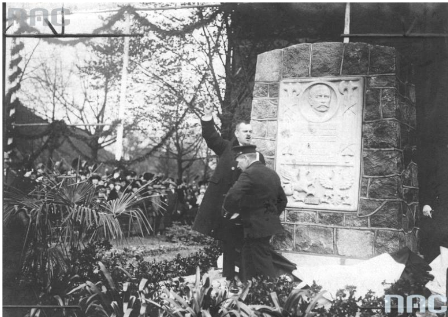
Narodowe Archiwum Cyfrowe, sygn. 1-U-6406

Encontro do Comitê Principal da Exposição Nacional em Poznań (Janeiro de 1929) (Fonte: adaptado de NAC - www.audiovis.nac.gov.pl ) [ Zjazd Rady Naczelnej Powszechnej Wystawy Krajowej w Poznaniu (styczeń 1929 r.) ] (Źródło: adaptacja z NAC - www.audiovis.nac.gov.pl )